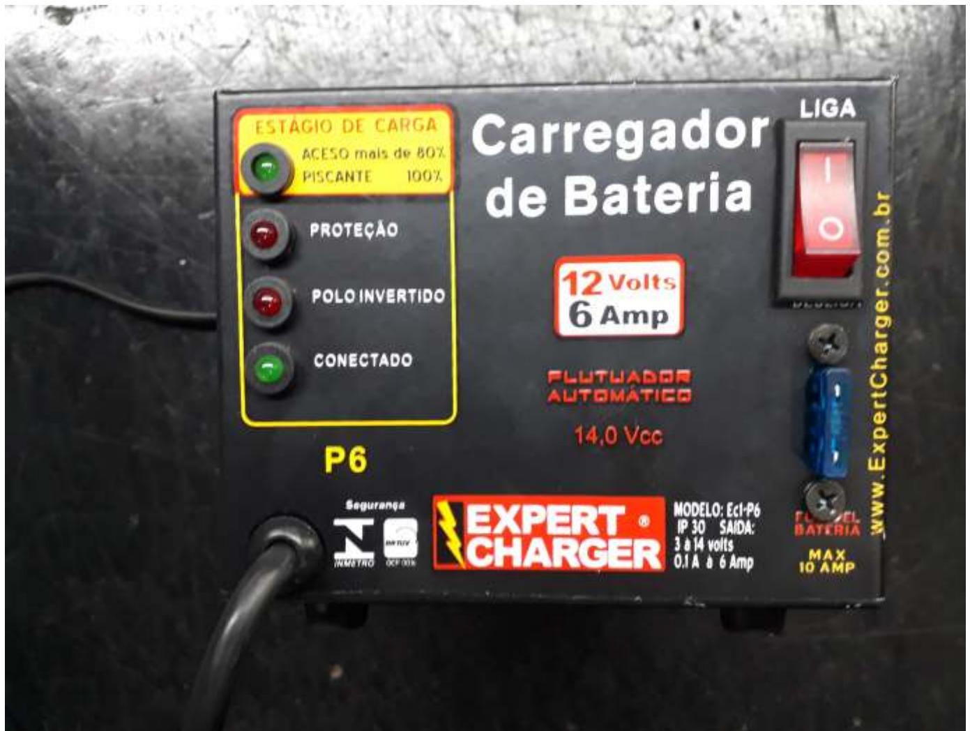
Expert-Charger EC1-P6 carregador de baterias